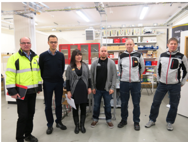
Ny utrustning invigs av företag, rektor och lärare.

Inom Teknikcollege i Köping har Ullvigymnasiet tillsammans med samverkansföretagen Volvo Group Truck Operations, GKN Driveline, LEAX och Gnutti Carlo investerat i ny utbildningsutrustning för studerande som läser EI- och energiprogrammet, inriktning Automation. Dagens industrier blir allt mer automatiserade och för att forma anställningsbara studerande måste utbildningen hålla samma kvalitet och utvecklingsmöjligheter. Utrustningen kommer inte bara att ge de studerande ett kvalitetslyft i sin utbildning utan företagen kommer även ha möjlighet att utnyttja den nya utrustningen i kompetensutvecklingen av deras egna anställda. Genom samverkan inom Teknikcollege har man lyckats identifiera konkreta och resurseffektiva samarbetsområden som ger mervärde för alla parter.