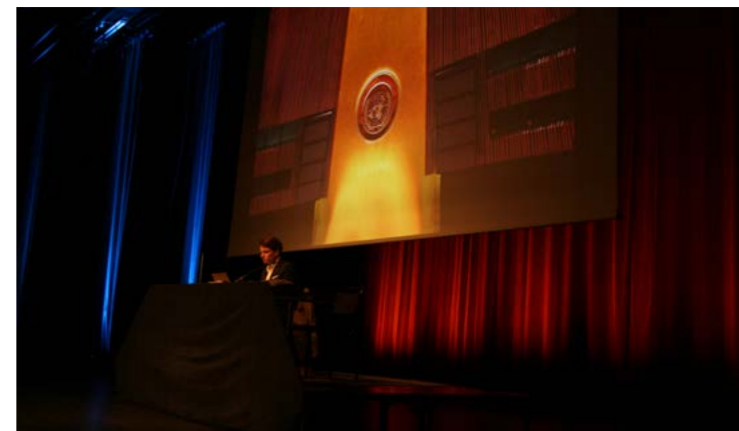
Herr Ordförande håller uppe stämningen inne i plenum.

Arrangera ett FN-rollspel är en stor uppgift som många skolor runt om i Sverige tar på sig. Det är inte det enklaste att styra upp därför kan de vara smart att börja på en liten skala första gången man ska utföra det. Internationell politik är något man får med sig mycket kunskap om efter ett FN-rollspel. Det ökar även elevens engagemang och tro på att man faktiskt kan vara med och påverka i världen och att allas röster spelar roll. Man tränar också upp sina färdigheter som delegat i att kommunicera både muntligt och skriftligt. Dessutom så tränar man på källkritik och får se olika perspektiv på frågor man tar sig an. Elever som tidigare inte varit bekväma med att ta plats i skolan ökar sitt självförtroende i olika debatter och inser att dom faktiskt trivs i de. Eftersom att man är påläst och går in i en annan roll när man representerar